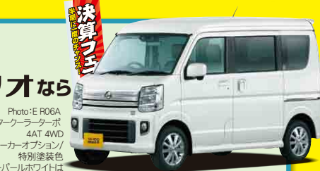
Photo:E R06A インタークーラーターボ 4AT 4WD メーカーオプション/ 特別塗装色 スノーパールホワイトは 22,000円(税込)高。

NV100クリッパー リオ E R06A インタークーラーターボ 4AT 4WD ボディカラー/スノーパールホワイト 車両価格 2,333,792円 (消費税抜価格2,121,630円) 車両本体価格1,908,500円