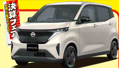
Photo:G MM48 20kWh 2WD

G MM48 20kWh 2WD ボディカラー/ホワイトパール 車両価格 3,483,580円 (消費税抜価格3,166,891円) 車両本体価格3,040,400円