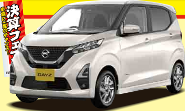
Photo:ハイウェイスターX BR06-SM21 CVT 2WD メーカーオプション/特別塗装色ホワイトパールは33,000円(税込)高。

ハイウェイスターX BR06+SM21 CVT 2WD ボディカラー/ホワイトパール 車両価格 2,194,329円 (消費税抜価格1,994,845円) 車両本体価格1,592,800円