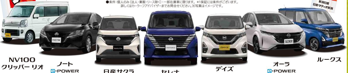
NV100 クリッパー リオ

●条件:個人のみ(法人・業販・リース除く)・一部在庫車に限ります。*1保証には条件がございます。詳しくはカーアドバイザーまでお問合せください。※写真はイメージです。