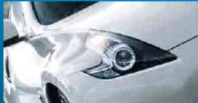
コーティング層イメージ図