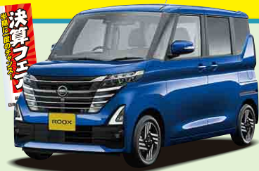
Photo:ハイウェイスターX BR06-SM21 CVT 2WD

ハイウェイスターX BR06-SM21 CVT 2WD ボディカラー/オーシャンブルー 車両価格 2,214,020円 (消費税抜価格2,012,746円) 車両本体価格1,840,400円